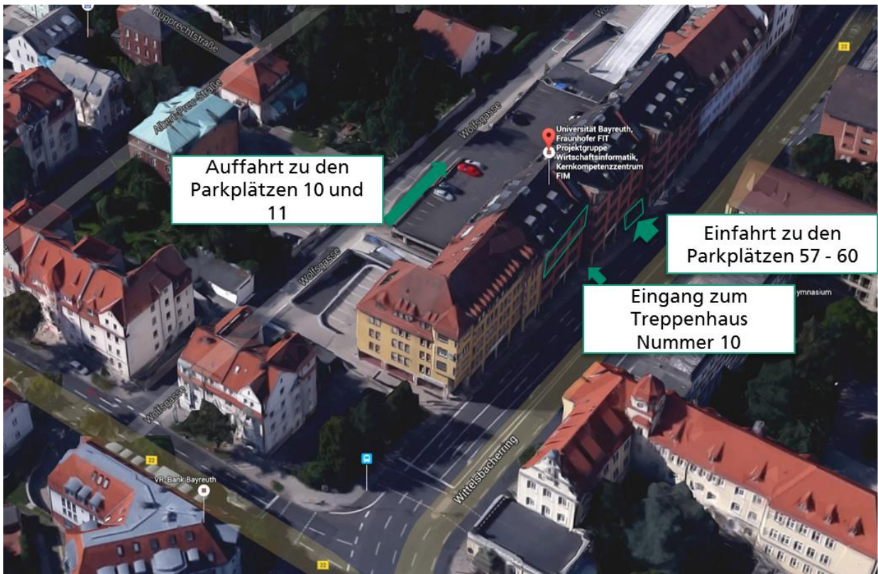
Abbildung 2: Zufahrt zu den Parkplätzen